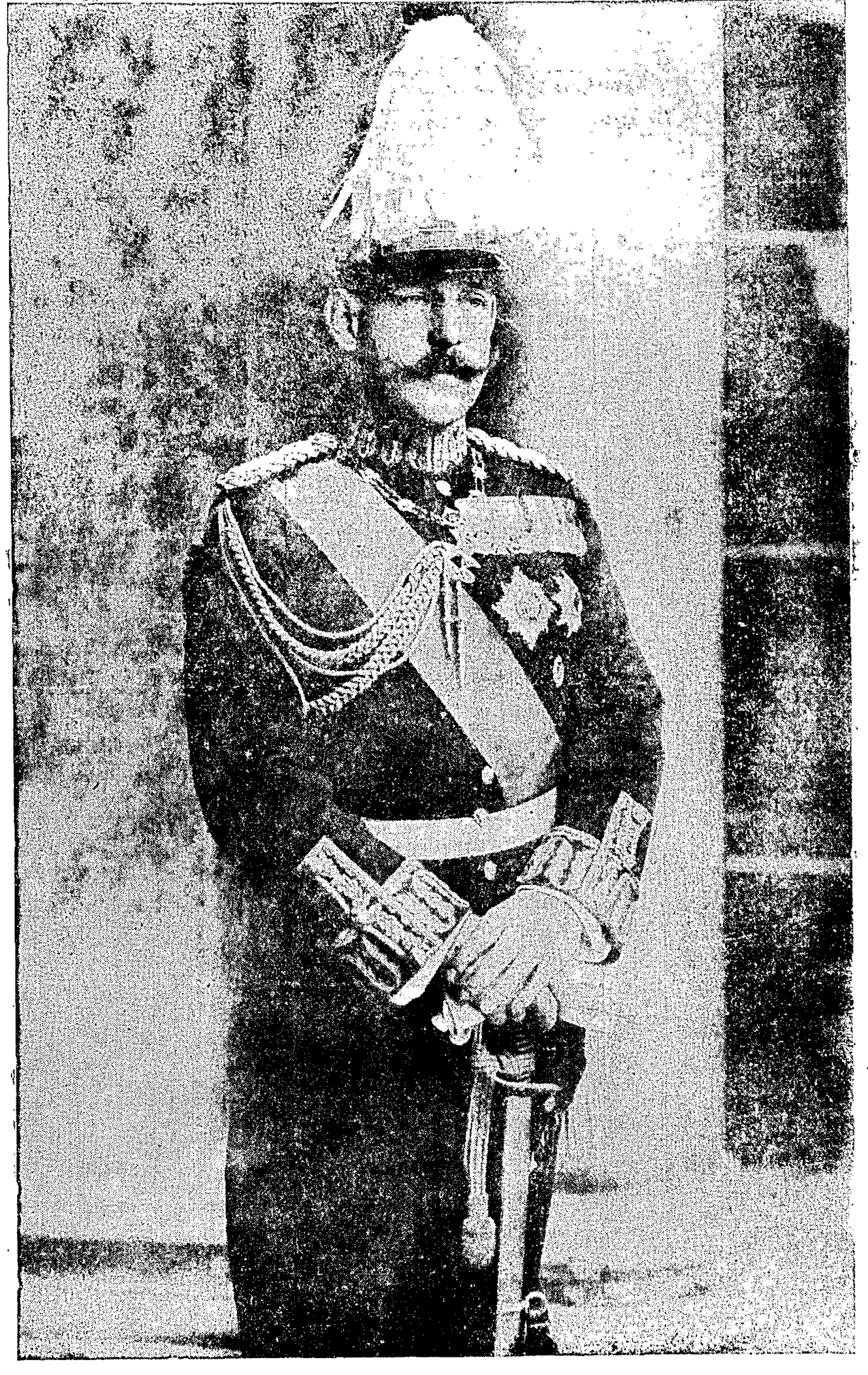
Ὁ Δεχιστράτης τοῦ Ἑλλ. στρατοῦ καὶ Διάδοχος τοῦ Ἑλλ. θρόνου, ὅστις χθὲς εἰσῆλθε μετὰ τῶν στρατευμάτων του εἰς τὴν Θεσσαλονίκην.