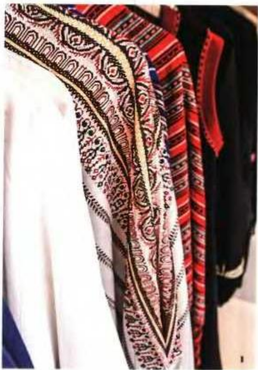
1 | Σάλια υφανμένα από Ελληνίδες τσενίτριες. 2 | Σουένι γλέσκο φτιαγμένο από τον Βάσια Τσιπόγιαννη. 3+4 | Λιτή clutch bag και χειροποίητη κρεμαστή τσάντα ώμου, και οι δύο σε σχέδιο της Sophia Kokosalaki για την TRIA ETC.