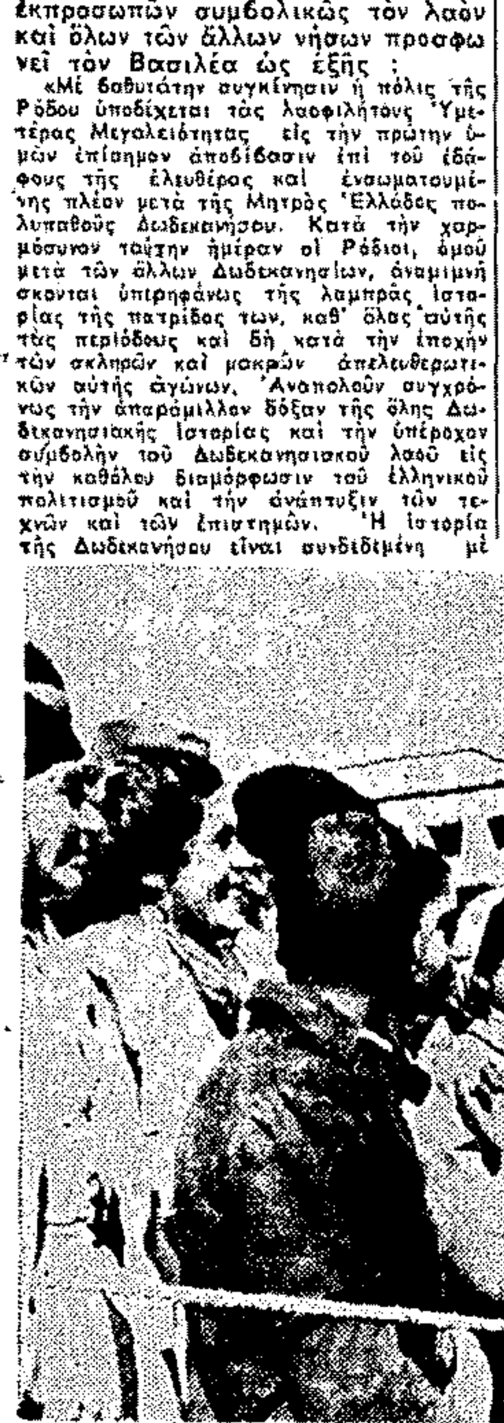
Ο Κ. Παπανδρέου με την επίσημη... Ο Κ. Παπανδρέου με την επίσημη...